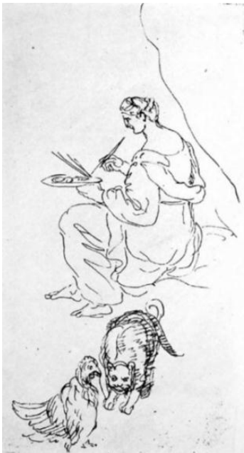
კასტელი; ქართველი მხატვარი ქალი

გერონტი ქიქოძე წერს, რომ „კლიმატური პირობების გამო ყველგან“ ვერ მოხერხდება მარტივი სამოსის აღდგენა, რომ „ამის წინააღმდეგ ზნე-ჩვეულებაც ამხედრდებოდა“, მაგრამ, აღნიშნავს, რომ ასპარეზობათა დროს „შესაძლებელიც არის და საჭიროც სხეულის ნახევროთ გატიტვლება“; მისი თქმით, „ამით მოიგებს არა მარტო ჰიგიენა, არამედ ესთეტიკაც: ერთი უმშვენიერესი სანახაობა მზის სხივებში გახვეული ვაჟკაცია“ (ქიქოძე, 1919, გვ.186); აქ ისევ ჩანს მისი ნაშრომის გავლენა „შევარდენზე“; ძველ ელინებთან სრულ მიმსგავსებას, ცხადია, არ ითხოვს მწერალი, ხალხთა „ზნე-ჩვეულებებს“ ითვალისწინებს, თუმც, მიაჩნია, რომ თანამედროვე ქართველებთან შედარებით, ბევრად უკეთესი იყო უწინდელ ქართველთა ცხოვრებისეული წესი; ავტორი ამ ნაშრომში კრისტოფორო დე კასტელის ნახატებზე დაყრდნობით მეჩვიდმეტე საუკუნის ქართველებზეც საუბრობს და უფრო ადრინდელ პერიოდზე საუბრისას კი „ვეფხისტყაოსანს“ იმოწმებს (ჩანს, ქართულ რეალიებს ხედავს პოემაში);