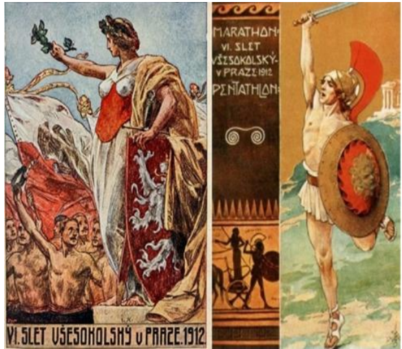
„სოკოლის“ ფესტივალებისადმი მიძღვნილი სურათები

ითქვა, ცხოვრებაში მშვენიერების დამკვიდრება იყო (როცა ჩეხური ფესტივალების პლაკატებს, მხატვართა შემოქმედების ნიმუშებს გავეცნობით, დავინახავთ ულამაზესი გარეგნობის ქალებსა და ვაჟებს, რომლებიც იერსახით, ტანადობით ქანდაკებებსა თუ კერამიკაზე გამოსახულ ძველ ელინებს ჰგვანან (იხ. სოკოლი 150, 2012, გვ. 34-195); მზისა და სიცოცხლის ფერები ჭარბობს მათ ნახატებზე... ჩეხებმა ბევრის გაკეთება მოასწრეს, „შევარდენს“ მხოლოდ ნაწილობრივ დასცალდა დასახული მიზნების შესრულება, მაგრამ მათი გამოცემებისა და ამოცანათა გაცნობა ნათელ წარმოდგენას გვიქმნის, თუ რას წარმოადგენდა ეს საზოგადოება, რომ სპორტი მხოლოდ ერთ-ერთი შემადგენელი ნაწილი იყო ამ მოძრაობისა და საზოგადოებრივი ცხოვრების სხვადასხვა სფეროში ისეთი სულიერების შეტანას აპირებდა, რომელიც სიკეთითა და სიცოცხლით, მშვენიერებით გაამდიდრებდა ადამიანსა და მის ცხოვრებას. ელინურის მსგავსი მშვენიერების ესთეტიკამ (ვფიქრობ, ტერმინი