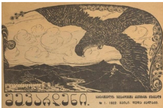
ჟურნალ „შევარდენის“ გარეკანი; ემზღებ